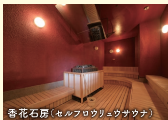
香花石房(セルフロウリュウサウナ)