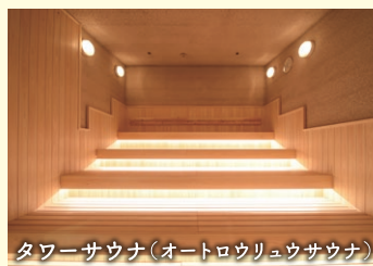
タワーサウナ(オートロウリュウサウナ)