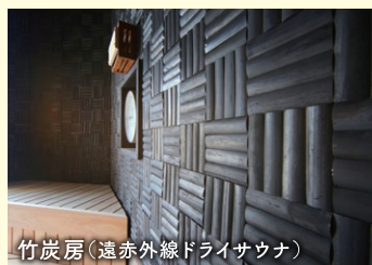
竹炭房(遠赤外線ドライサウナ)