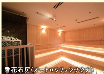
香花石房(オートロウリュウサウナ)